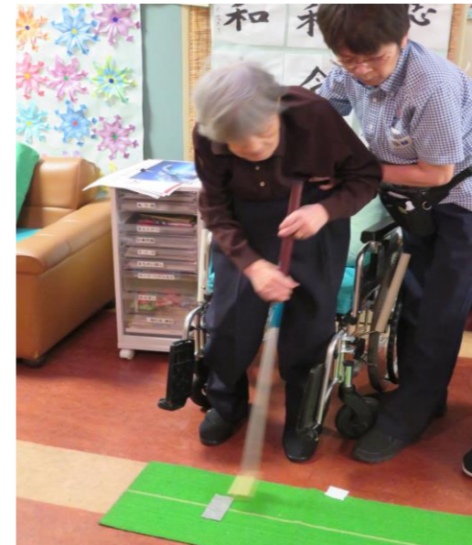
パターゴルフ やる気満々！