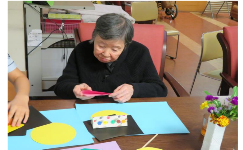
おりがみクラブ 先生のをみて折ってます。