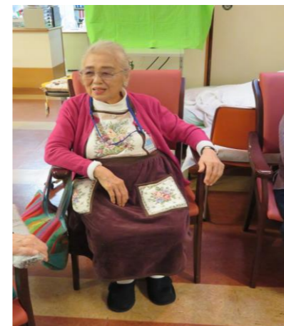
次は、何を歌おうかしら？