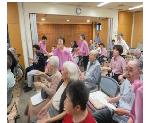
七夕まつり皆さんで飾りを作りました。 合唱コンサート・流しそうめん 盆踊りの様子です。