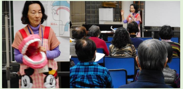
2月8日 大森西二丁目三和会 健康講演会