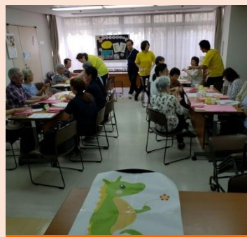
1号店 ころぼ大森 Organic Farmで営業中 8月はお休みのため施設で…