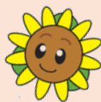
おおもり キャラクター ひまわりん