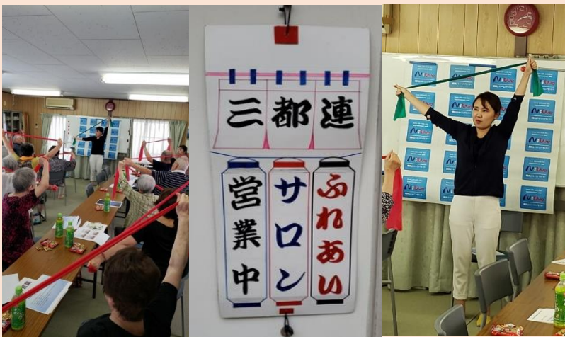
2号店 特養大森 いきいきシニアサロンと コラボレーション!

1号店(14日) りゅうじん訪問看護ステーションさんがハンドマッサージ 2号店(6日) 地域見守り活動の学習と脳トレクイズ