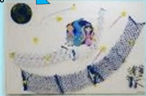
七夕飾り！ 「宇宙から天の川！」