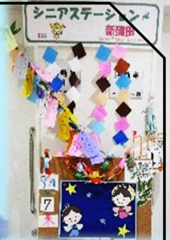
皆さんの願い事を飾りました！