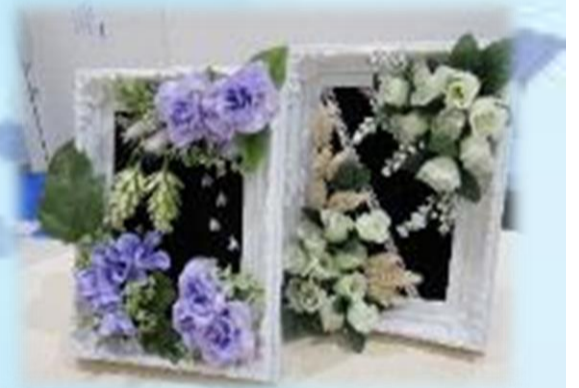
今回のサリーちゃんの手遊び 「額縁フラワーアレンジ」