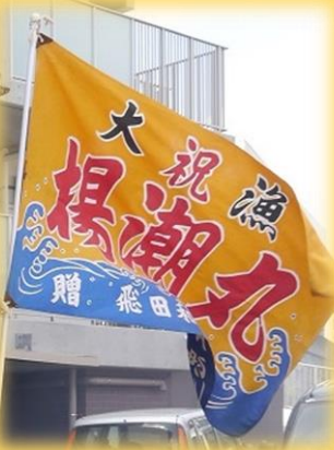
大漁旗に浮き輪・・・ 磯のかおりが 感じられます。