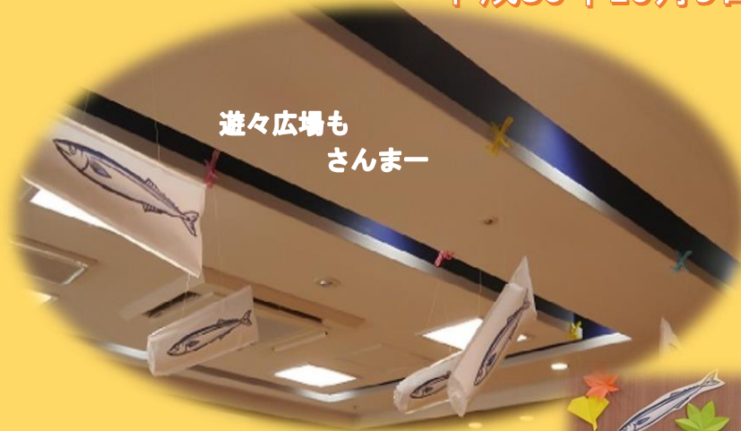
遊々広場も さんまー