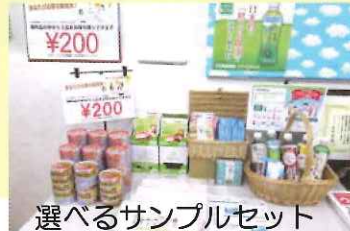
選べるサンプルセット

入店時に入場料500円をお支払いし、店内でワンドリンク（コーヒー、紅茶、ジュースなど）をいただけて、お土産としてお好きな商品サンプル（食品や日用品）を持ち帰ることができます。